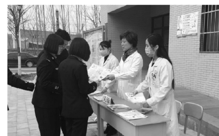
世界防治结核病日宣传活动一角