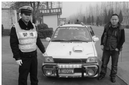
杨小卫生前工作照片

2013年2月23日晚,宝鸡市虢镇北坡发生交通事故,在处理交通事故中,为抢救群众英勇牺牲。陕西省人民政府于2013年10月14日评定杨小卫为革命烈士。2013年3月19日,学院发出《关于向优秀毕业生杨小卫学习的决定》,并命名司法警察系刑事执行专业一区队为“杨小卫区队”。