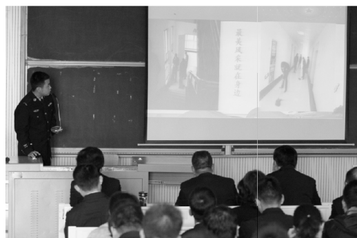
学生代表在总结会上发言