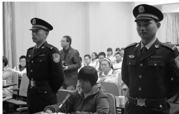
法律系学生走进中学举办模拟法庭开展法治教育

法律文秘专业 （省级重点专业）培养德、智、体、美全面发展，具有爱岗敬业、忠于职守、诚实守信等职业素质，熟练掌握法律和文秘基本原理，具备法律运用和文秘业务能