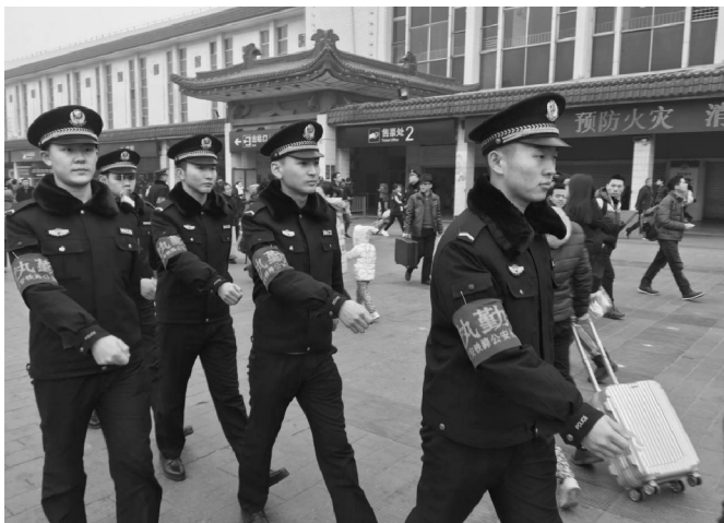
2017年治安警察系学生在西安火车站进行春运执勤

司法警务专业 （省级重点专业、省级专业综合改革试点项目专业、中央财政支持专业）培养拥护党的基本路线，政治坚定，具有良好的警察职业素养、法律素养和人文素养，熟悉相关法律法规，掌握治安管理、司法警务专业知识及应用技能，能胜任基层公安机关和司法警察工作岗位需要的高素质实战型警务人才。