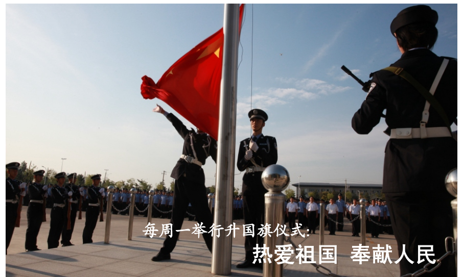
每周一举行升旗仪式： 热爱祖国 奉献人民