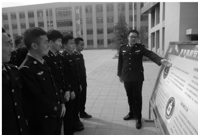
警察技术系承办学院“国家安全教育周”活动

司法信息安全专业 （省级重点专业）培养拥护党的基本路线，政治坚定，具有良好的警察职业素养、法律素养和人文素养，熟悉相关法律法规，掌握治安管理、司法警务专业知识及应用技能，能胜任基层公安机关和司法警察工作岗位需要的高素质实战型警务人才。