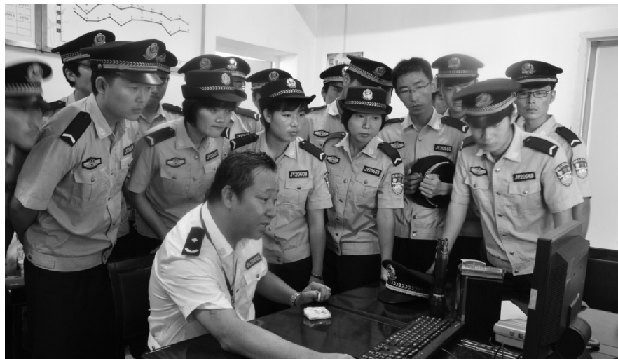
司法警察系刑事执行专业学生开展现场教学

行政执行专业 属于公安与司法大类法律执行类专业。本专业培养政治合格、掌握法律专业知识和行政执法基本理论与实战技能，能够胜任基层强制隔离戒毒、城市管理综合行政执法一线工作岗位的应用型、职业型人才。