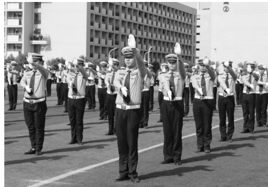
交通指挥操：展现职业技能

根据《关于公安院校公安专业人才培养制度改革意见》精神：公安院校公安专业毕业生招考工作实行全国统一考试，分省（区、市）录用的办法。每年定期统一组织笔试，分省（区、市）确定录用计划、划定分数线、组织面试、体检、考察和录用。