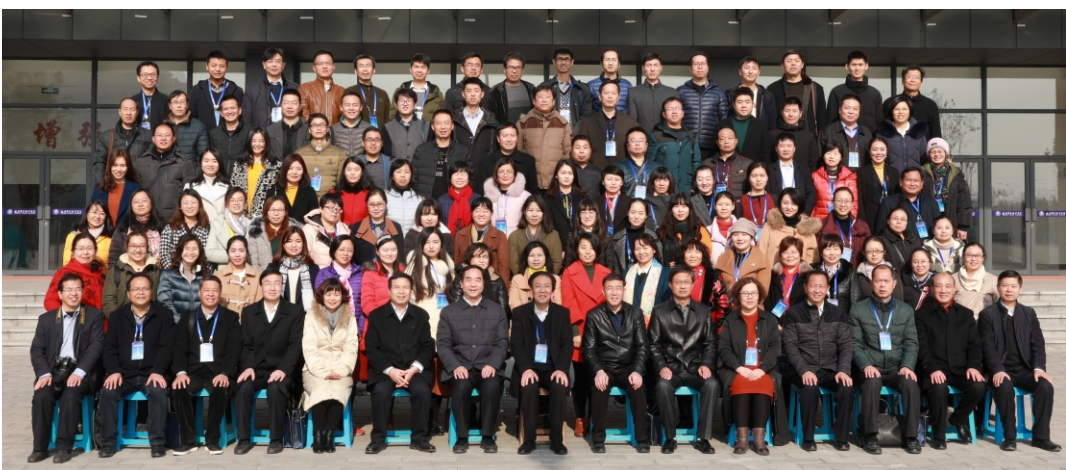
出席会议的有关领导及代表合影

12月8日至9日，陕西省职教学会思政教指委2017年工作年会暨“高校思政课教学质量年”典型工作经验交流会在西安召开。会议由陕职教思政教指委主办，陕西警官职业学院承办。来自全省27个高职高专院校的121名代表参加会议。