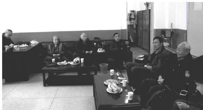
退休老干部谈“大学精神”

作为“过来人”，他们回顾了学院的发展历史。学院从1953年成立陕西省司法干部训练班起步，历经陕西省司法检察干部训练班、陕西省政法干部学校、陕西省司法学校（归属干校管理）、陕西省政法管理干部学