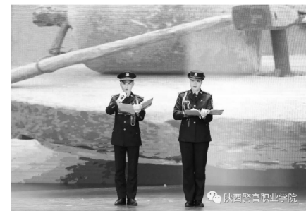
朗诵《为群众做实事是习近平始终不渝的信念》