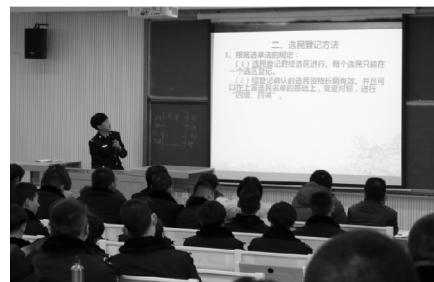
学院第四届宪法文化周“讲宪法”比赛